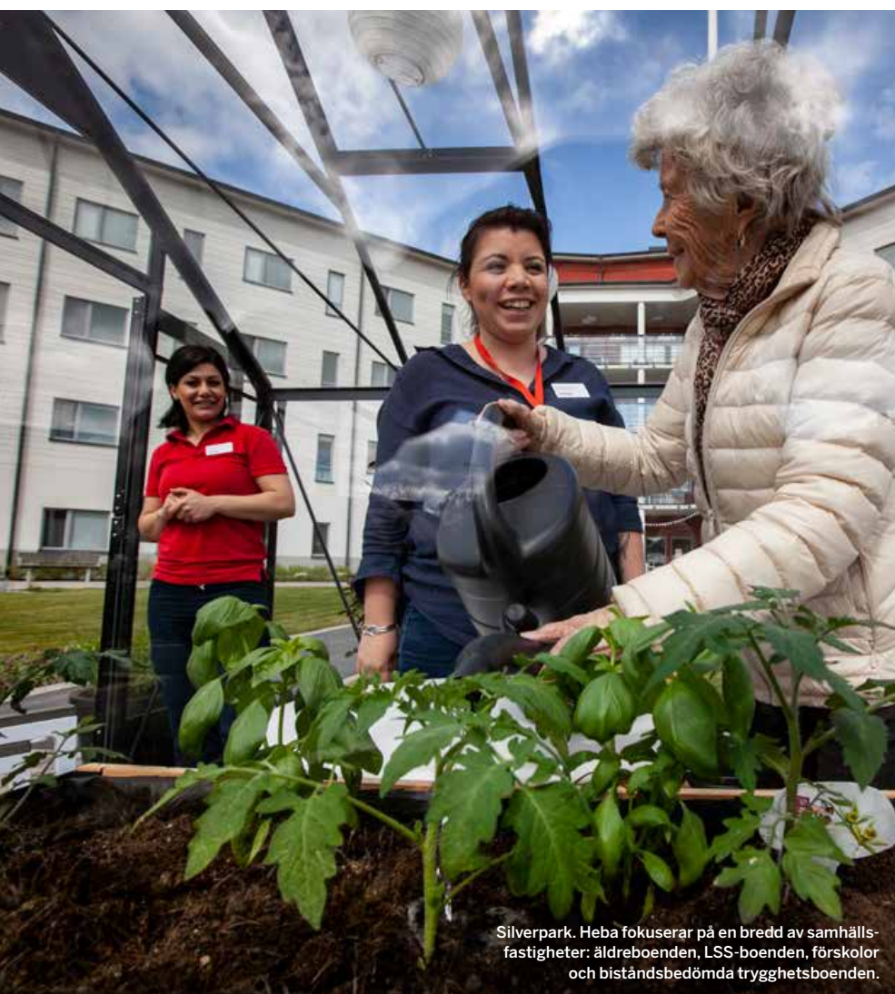
Silverpark. Heba fokuserar på en bredd av samhällsfastigheter: äldreboenden, LSS-boenden, förskolor och biståndsbedömda trygghetsboenden.